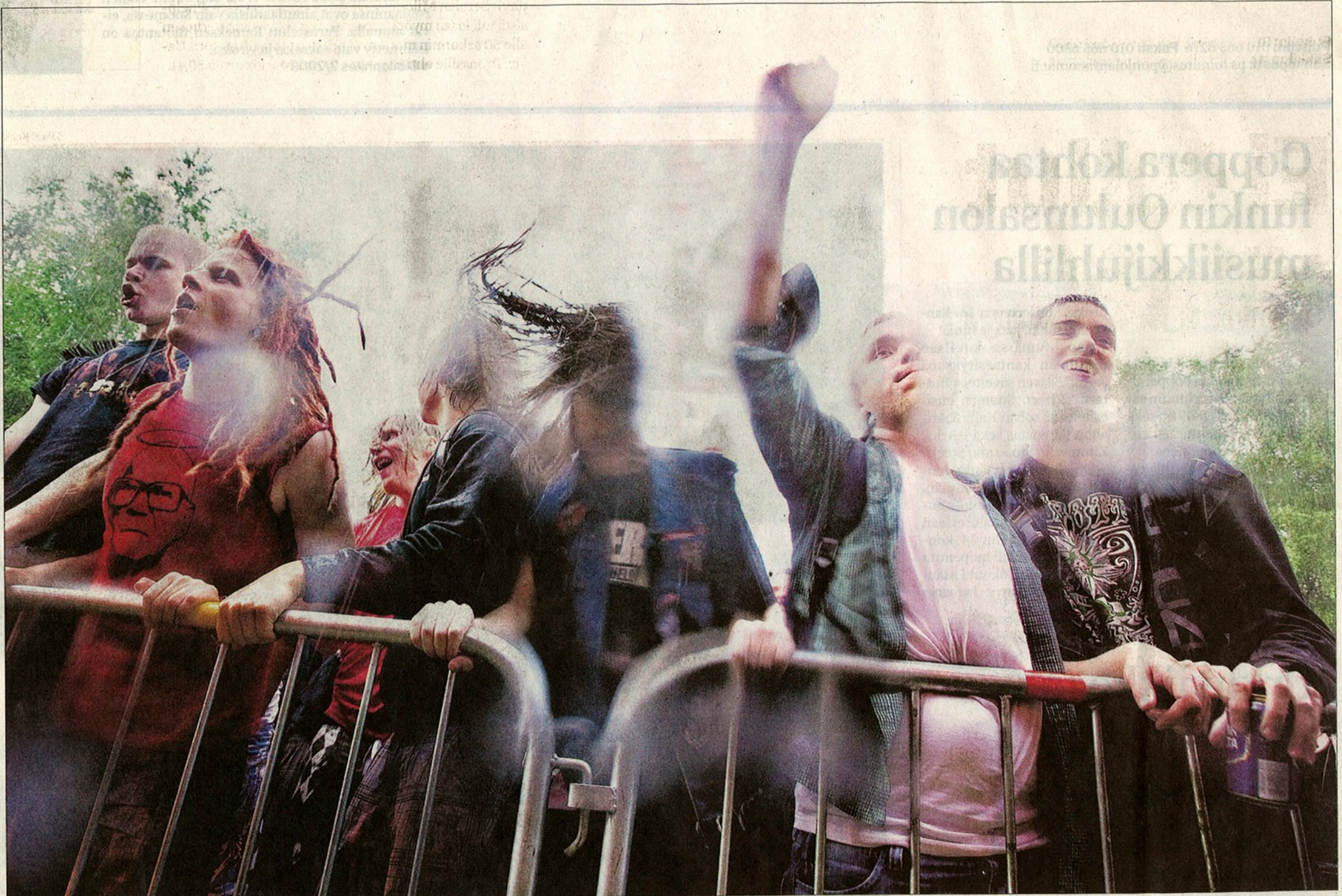
Mansikkanoikalla oli tunnelmaa kuin Alhonkadulla aikanaan.