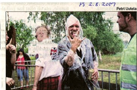
Alhonkaturock keräsi festariväen Kemlin Mansikkakanokalle. Hellepäivän paahteen vilvoitti sadekuuro.