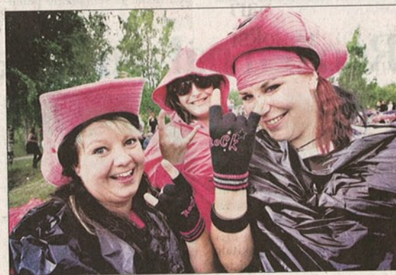
Tapahtumaan tultiin korostetusti pinkissä asussa, joka sateen vuoksi suojattiin mustalla jätessäkillä.