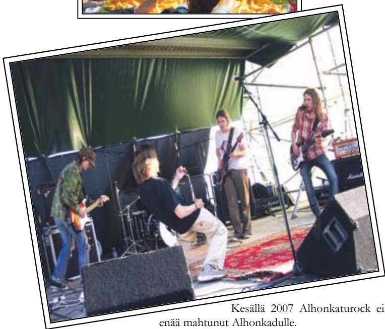
Kesällä 2007 Alhonkaturock ei enää mahtunut Alhonkadulle.